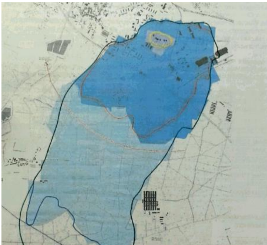
Abbildung 2: Trinkwasserschutzzone des Typs III B wie im Genehmigungsbescheid dargestellt, Quelle: Niemann, D. (2017): „Stickstoffprobleme in der Umwelt am Beispiel der Nitratakkumulation im Grundwasser im Umfeld der Tierhaltungsanlage für Schweine in Tornitz“